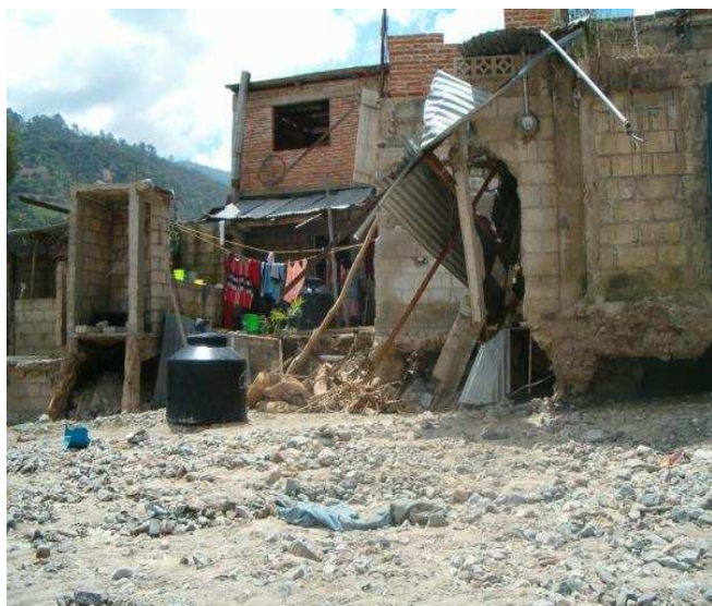
Palabra clave: Hurican Stan Mexico

Banco: HypoVereinsbank Munich; Am Tucherpark 16 (Calle), C.P. 80538 Munich (ciudad), Alemania; Código bancaria: 70020270; Cuenta bancaria: 60 30 26 88 63 Swift Code: HYVEDEMM IBAN DE 82 70020270 6030268863