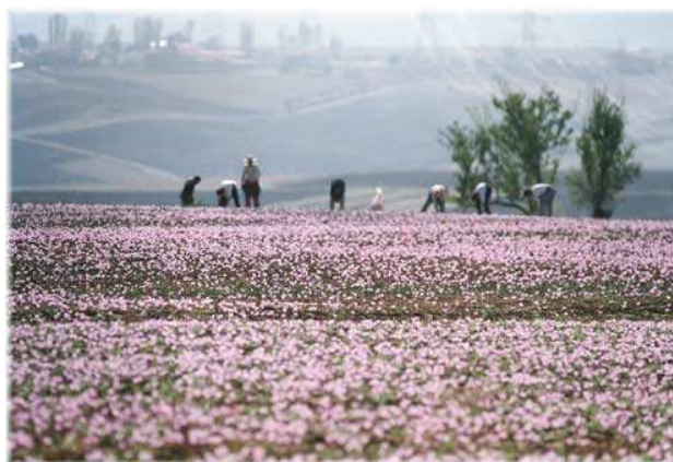
La cosecha de azafrán en Grecia

Naturland está contento de recibir como nuevo socio la única cooperativa de productores de azafrán de Grecia. ¡Bienvenidos! La región de Kozani es la única donde se cultiva azafrán en Grecia. La Cooperativa, fundada en 1971, sólo puede comercializar su propio azafrán griego. De momento se cuenta con 1080 miembros, de los cuales 250 con certificación orgánica. La producción de azafrán es muy trabajosa. Para obtener un producto de alta calidad es preciso contar con mucha experiencia y trabajar minuciosamente tanto en la producción de la materia prima, así como en el procesamiento. El azafrán se extrae de los estambres de una variedad de crocus que florece en otoño. Para obtener un kilo de azafrán se necesitan aprox. 150.000 de plantas de crocus correspondiendo a una área de más o menos 0,1 ha. Para más informaciones sobre la Cooperativa, entrar en contacto con Birgit Wilhelm ( b.wilhelm@naturland.de ) o directamente con la Cooperativa „Krokos Kozanis“ www.safran.gr o e-mail: sinkroko@otenet.gr