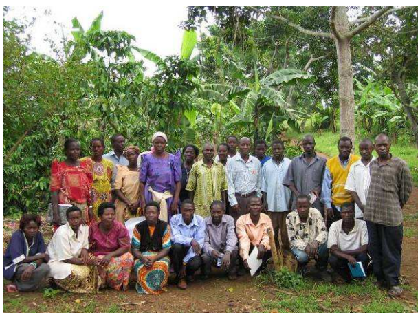
Este grupo de agricultores y agricultoras de Mbira (Uganda) produce maracuyá, aguacate (palta), banano enano.

Desde 2003 Naturland está certificando algunas organizaciones contrapartes del EPOPA (Programa de fomento de la exportación de productos orgánicos de África) en África. Durante esta cooperación el número de socios de Naturland en Uganda y Tanzania ha incrementado considerablemente. Hoy en día, el 10% de los socios internacionales de Naturland son de