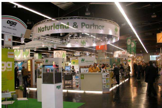
El stand de Naturland en la BioFach en Nuremberg