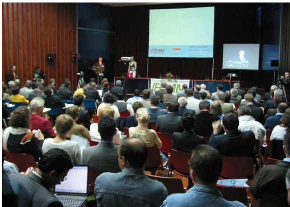
IFOAM Conferencia de Recolección Silvestre Mayo 2006

Los otros asuntos que complementaron el programa de dicha conferencia fueron los siguientes: estándares específicos, diferentes programas de certificación, comercialización, conservación del medio-ambiente, así como cultivación versus recolección silvestre. Por primera vez fue presentado el estudio "Visión global sobre la producción y comercialización mundial de productos silvestres orgánicos", elaborado por la ITC, que subrayó la dimensión e importancia de las recolecciones silvestres en el mundo. Esta conferencia, que contó con una organización extraordinaria, fue una piedra miliaria para los desafíos y el futuro desarrollo de la recolección silvestre.