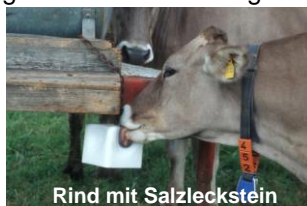
Rind mit Salzleckstein

Die deutsche Gesellschaft für Ernährungsphysiologie (GfE) hat auch für Tiere Nährstoffempfehlungen erarbeitet. So ergänzen die meisten Tierhalter